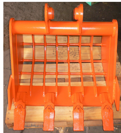
スケルトンバケット

本機のサイズに合わせたバケットを取り扱っております。バケットの中や形状など、お客様のご要望に合わせた特殊型も製作可能です。まずはお気軽にご相談ください。